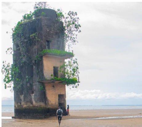
Abb: Dies sind die Reste der Gefängnisruine. Bei Ebbe ist der Turm zugänglich, bei Flut steht er im Wasser

Auf der Insel befindet sich ein ehemaliges deutsches Gefängnis aus der Kolonialzeit. Rudolf Duala Manga Bell wurde dort vor seiner Hinrichtung im Jahr 1914 inhaftiert. Die Gefängnisruine existiert bis heute als Zeugnis der brutalen Kolonialgeschichte.