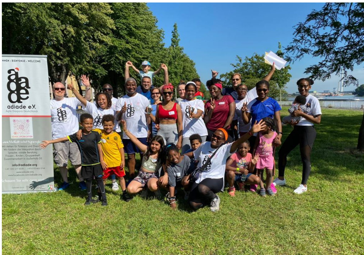
Auftakt am 03.07.2021