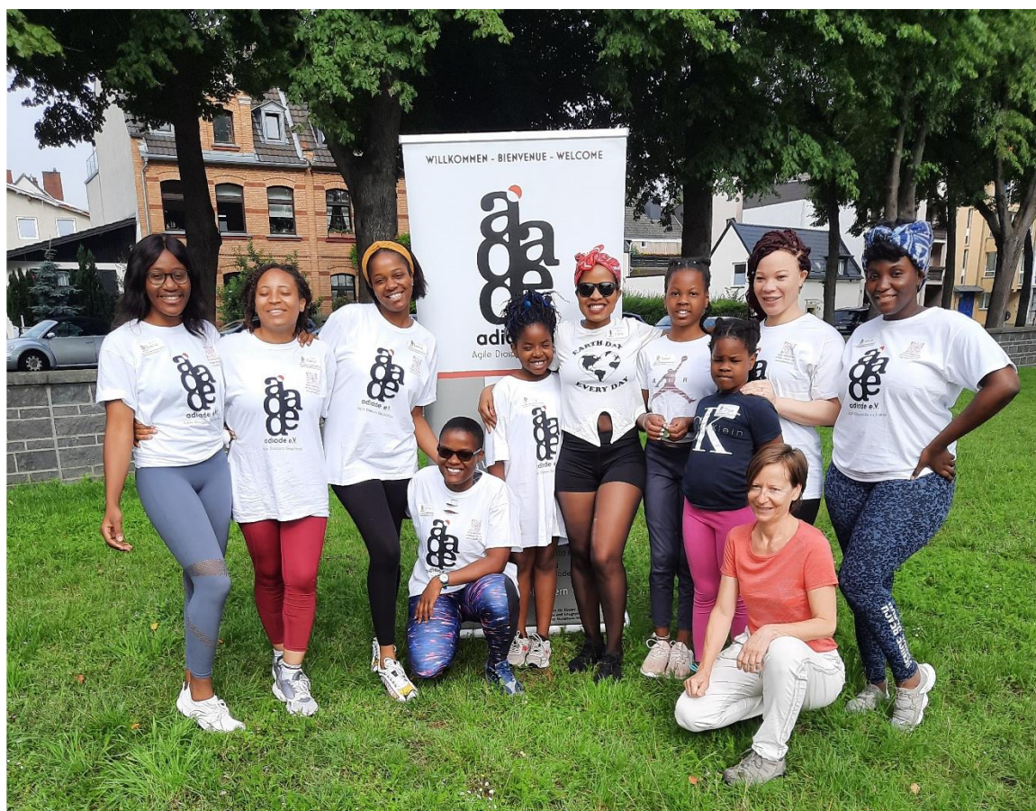
@adiade e.V. – Gruppenbild vom 10.07.21